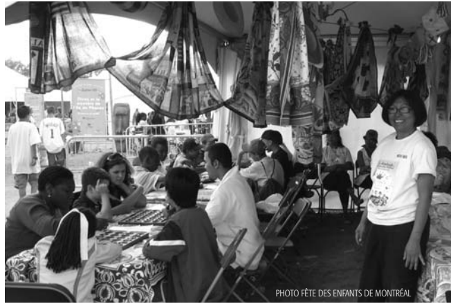
PHOTO FÊTE DES ENFANTS DE MONTRÉAL

En 1999, la Ville de Montréal mettait sur pied la première Fête des enfants de Montréal (FEM) qui attira plus de 30 000 visiteurs au Parc Maisonneuve pour une journée remplie d'activités. Au fil des ans, La Fête a grandi. L'année dernière plus de 266 000 personnes sont venues et aujourd'hui ce sont plus de 120 organismes ou associations qui s'impliquent, avec l'appui de plus de 800 bénévoles, pour faire de La Fête un grand événement familial.