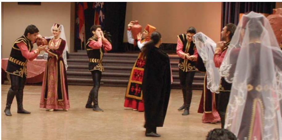
ENSEMBLE ANI DE L'ASSOCIATION CULTURELLE ARMÉNIENNE HAMAZKAYIN