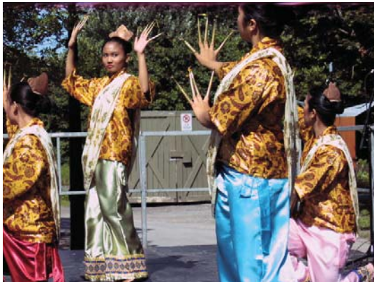
GROUPE PAMANA PHOTO ARCHIVES SPEQ

▶ Entrée gratuite sur le site. Pour plus de détails : www.festivalcouleursdumonde.com