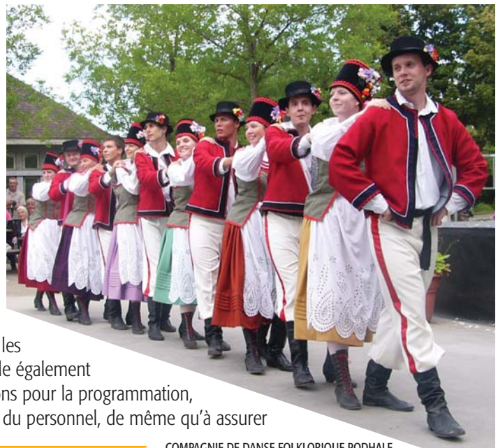
COMPAGNIE DE DANSE FOLKLORIQUE PODHALE

Comme par le passé, le mandat et les tâches de la SPEQ consistent surtout à recruter les artistes issus des communautés ethnoculturelles, à créer pour eux un lieu convivial et à les tenir informés des modalités liées à l'événement. La SPEQ veille également à satisfaire aux besoins des artistes, à faire des recommandations pour la programmation, à préparer la documentation pour les présentations, à recruter du personnel, de même qu'à assurer la coordination logistique pendant l'événement.