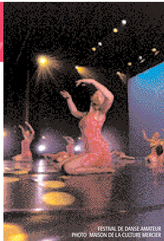
FESTIVAL DE DANSE AMATEUR PHOTO MAISON DE LA CULTURE MERCIER

Près d'une quinzaine de personnes de tout âge provenant de groupes associés au milieu du loisir culturel montréalais ont ainsi acquis de nouvelles compétences dans la production de spectacles. D'une durée totale de 12 heures, la formation comportait un volet théorique et un volet pratique, axés sur le chant, la danse, la musique, le théâtre et le multimédia. Une attestation a été délivrée à tous les participants de la formation. La production de spectacles en loisir culturel espère bien répéter l'expérience l'an prochain avec autant de succès. C'est un rendez-vous !