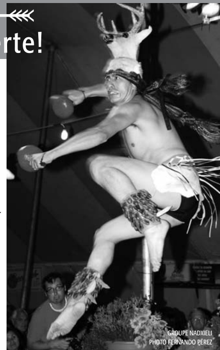
GRUPE NADIELI